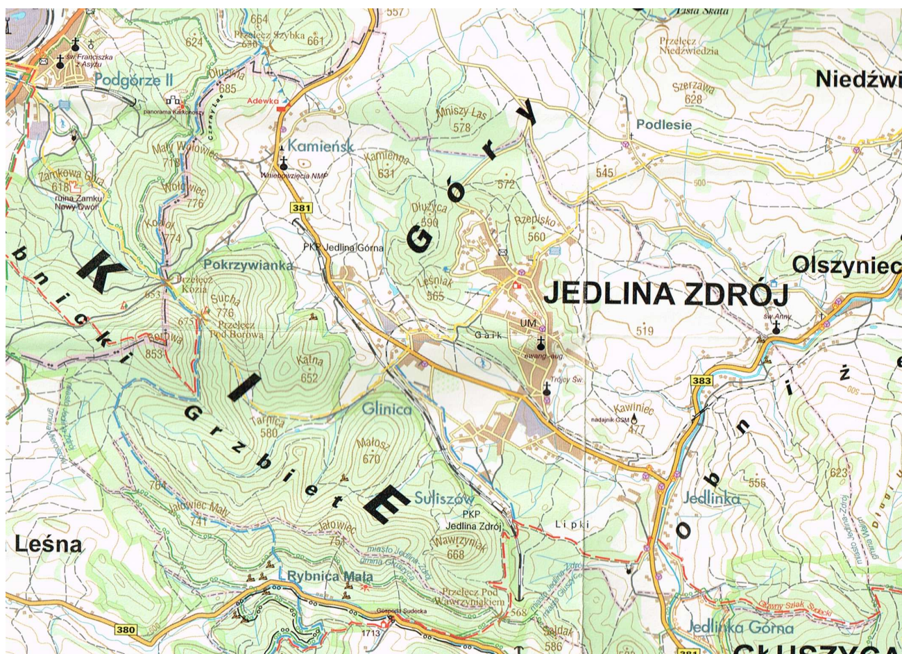
Ryc. 1 Jedlina-Zdrój - położenie